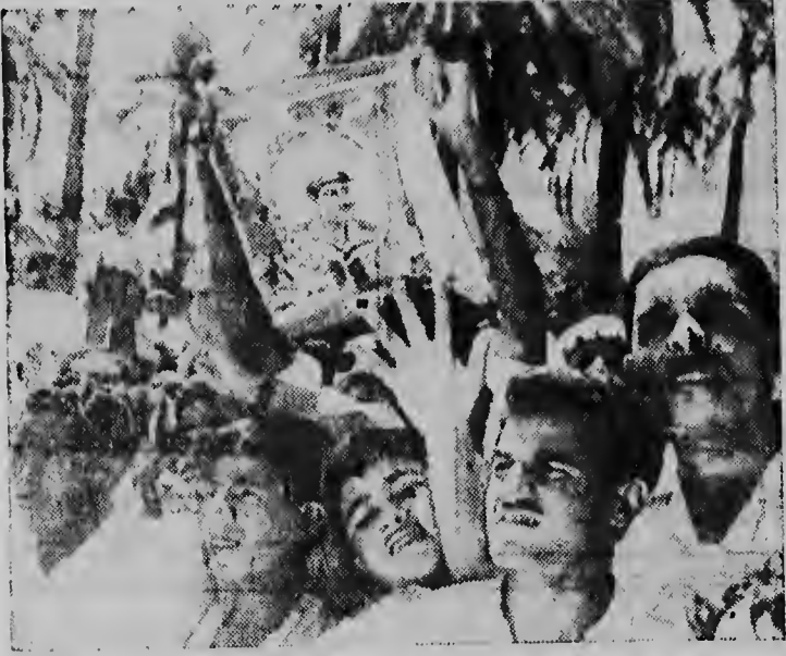
HOERA VOOR NASSER. — Met een groot portret van de president van de VAR Gamal Abdel Nasser, demonstreerden de Iraaken voor de Britse ambassade te Bagdad. De demonstratie viel samen met het tekenen van een wederzijdse defensieverdrag tussen het nieuwe regiem van Irak en de VAR.